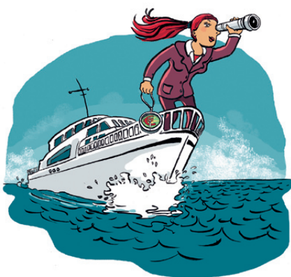
Illustration: Barbara Yelin, http://barbarayelin.de/