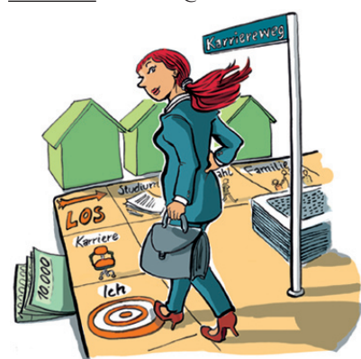
Illustration: Barbara Yelin, http://barbarayelin.de/