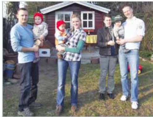
Abbildung 1: Familie Reinholz und Familie Schulz mit ihren Kindern (Eicker, 2013)

lienaufgabe der Kinderversorgung. Deutlich wird dies vor allem durch die Bilder, die im Zusammenhang mit Familienmodellen präsentiert werden.