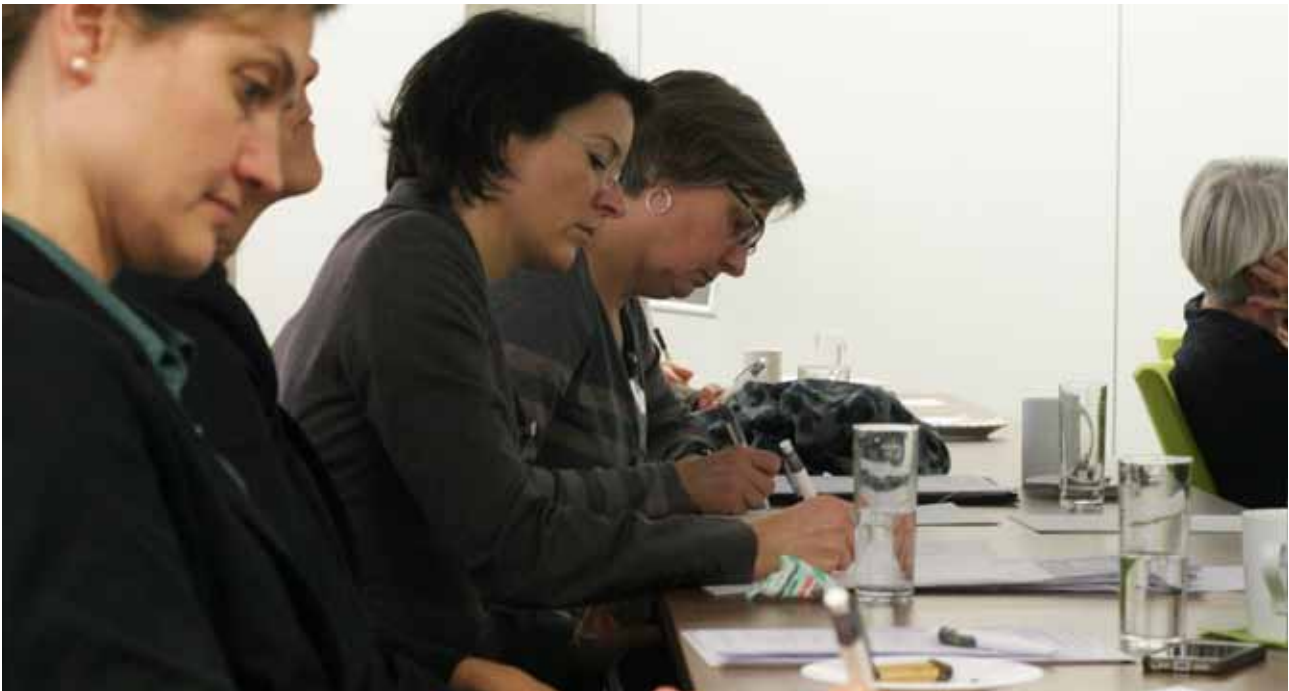
Blick ins Auditorium